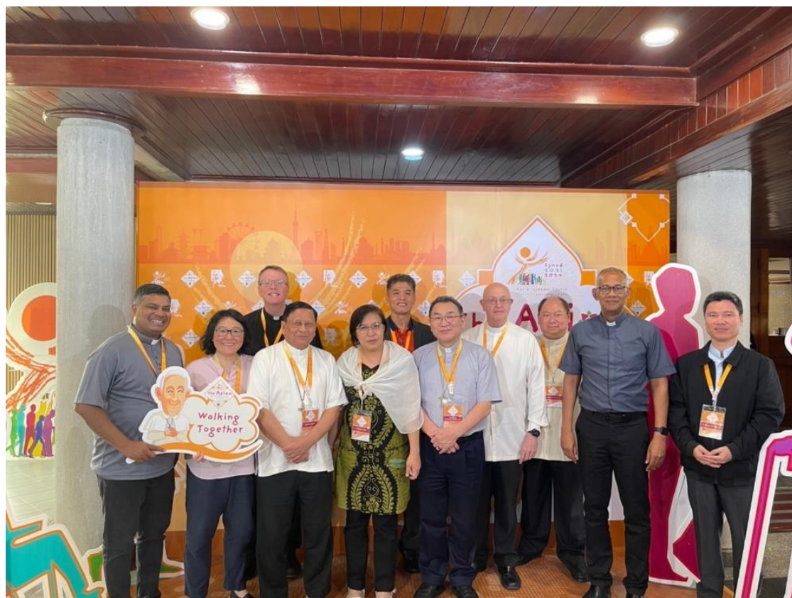
Kardynał Charles Maung Bo, SDB (Myanmar) Prezes FABC