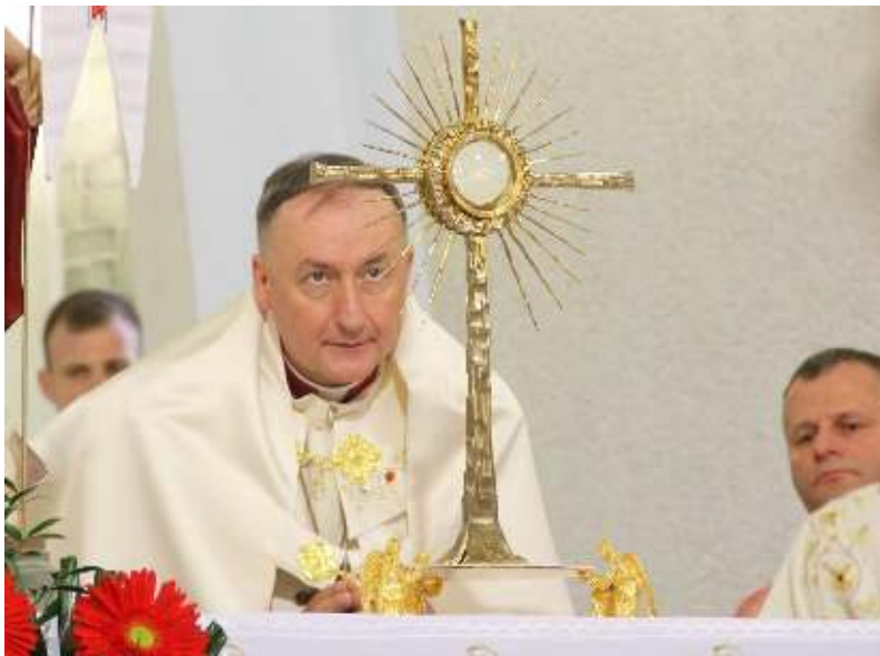
Inauguracja V SDT. Adoracja Najświętszego Sakramentu w dniu Inauguracji V SDT