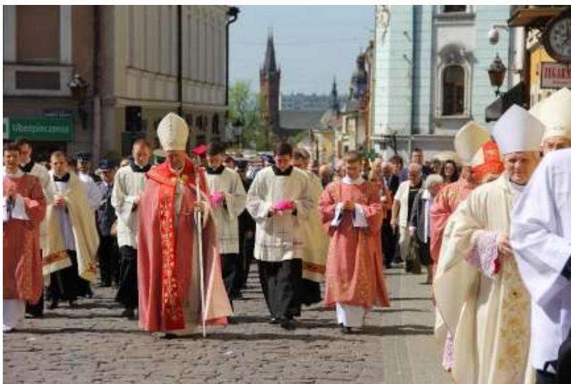
Inauguracja V SDT. Synod to wspólna droga. Uroczyste przejście z Sanktuarium Matki Bożej Fatimskiej do Tarnowskiej Katedry.

W okresie przygotowawczym Synodu, kiedy zbierano sugestie dotyczące zagadnień jakimi powinien zająć się V SDT, w znaczącej mierze były to kwestie liturgiczne. Był to drugi obszar, co do ilości napływających postulatów synodalnych.