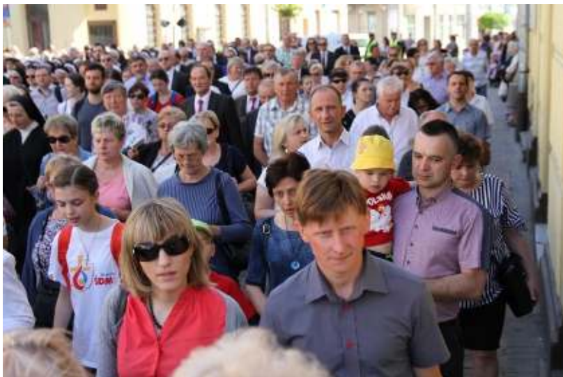
Uroczyste przejście do Katedry w dniu Inauguracji V SDT

które profetycznie odczytuje znaki czasu oraz wprost nawiązuje do tematyki drugiego etapu Synodu – tematu rodziny. Znajdujemy w niej następującą konkluzję: „Z doświadczenia można powiedzieć, że obszarem szczególnej troski staje się rodzina. Coraz częściej zdarza się (zwłaszcza w miastach), że dzieci mają możliwość usłyszeć o Panu Bogu, zarówno w szkołach jak i w naszych przedszkolach, tylko od nas”.