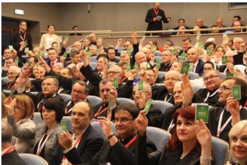
Głosowanie na II Sesji Plenarnej

Potrzeba rozeznawania „znaków czasu” została wyrażona już na samym początku prac synodalnych, kiedy rozpoczęto konsultacje diecezjalne mające na celu określenie kierunków Synodu. Nieustannie ta prawda jest przypominana podczas modlitwy synodalnej, która jest żywo obecna na różnych spotkaniach w diecezji, w codziennej modlitwie wielu zgromadzeń zakonnych, podczas comiesięcznych Niedziel Synodalnych, w spotkaniach formacyjnych różnych wspólnot, w audycjach radia diecezjalnego oraz w indywidualnych modlitwach wiernych. Modlitwa ta przypomina nam nieustannie, że Synod to Boże dzieło, do którego nas Bóg zaprosił i w tym dziele nas prowadzi. Mocno podkreślały tę prawdę odpowiedzi ankietowe dotyczące rozeznawania i podejmowania decyzji. Oto niektóre z nich: „Jako wspólnota ciągle uczymy się rozpoznawać znaki czasu. Pomocna w tym jest modlitwa”, „potrzeba dużo rozważli i mądrości w podejmowaniu decyzji rozpoznając znaki czasu”. Nie brakowało także odpowiedzi, które przedstawiały konkretne działania, które wynikły z takiego odczytania znaków czasu, jak np.: „rodzinne pielgrzymowanie szlakiem św. Jakuba, rozwija się coraz bardziej skupiając ludzi wokół historycznego dziedzictwa naszej świątyni i tradycji podążania do sanktuariów”.