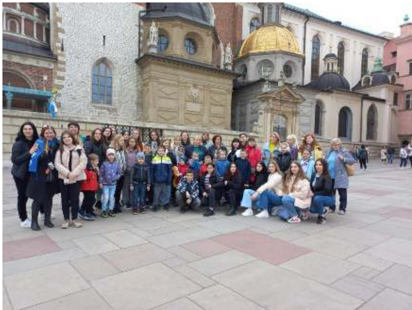
Wspólny wyjazd dla uchodźców z Ukrainy. Odkrywanie kultury i dziedzictwa Polski zorganizował Parafialny Odział Stowarzyszenia Rodzin Katolickich z Grybowa.

braku doświadczenia dialogu ekumenicznego wynikającego z faktu przebywania głównie z katolikami, sytuację tę zmieniła wojna na Ukrainie. Pomoc rodzinom ukraińskim naturalnie dała możliwość spotkania innych wyznań chrześcijańskich i rozmowy na temat wiary, tego co nas łączy i dzieli. Oto przykładowe odpowiedzi: „jeśli jest możliwość, to potrafimy”, „nie mam okazji i doświadczenia”, „mamy wiele przykładów dialogu ekumenicznego, szczególnie gdy obecnie przebywa wśród nas wielu Ukraińców obrządku prawosławnego”, „dialog ekumeniczny powinni prowadzić osoby do tego bardzo dobrze przygotowane doktrynalnie i teologicznie. Pozostali, powinni ich wspierać swoimi modłtawami i szczerym zainteresowaniem. Dialog ekumeniczny jest absolutnie konieczny!”.