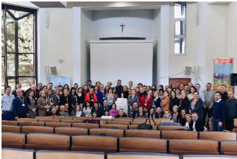
Spotkanie formacyjne słuchaczy Studium Parafialnej Aktywności