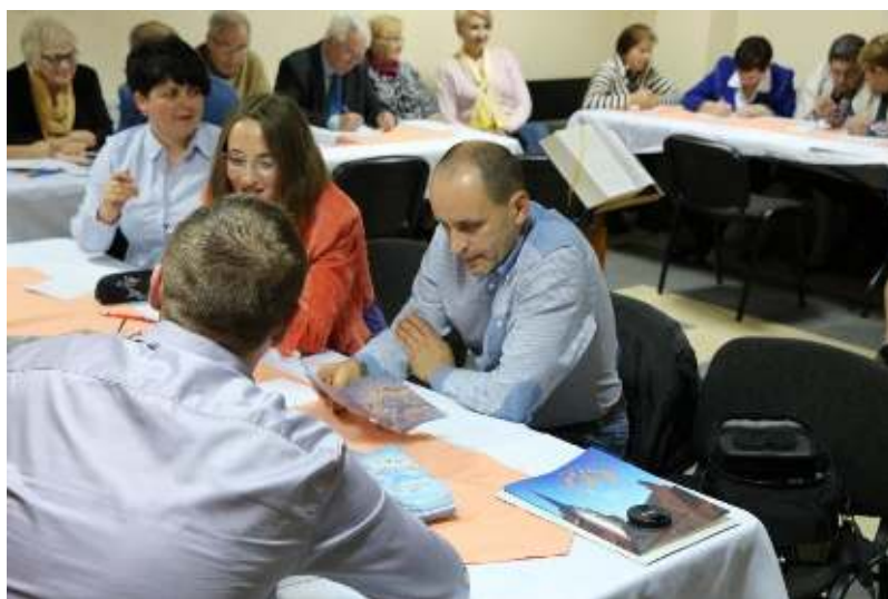
Spotkanie Parafialnego Zespołu Synodalnego

Zdecydowanie, w opinii odpowiadających na to pytanie, Synod dał możliwość spokojnego, merytorycznego dialogu, o czym świadczy m. in. następująca wypowiedź: „V Synod Diecezji Tarnowskiej – poprzez zbieranie «oddolnych» informacji i ich analizowanie oraz wyjście naprzeciw wiernym, aby prowadzić dialog w sprawach trudnych – jest przykładem słusznego działania w kierunku rozpoznawania znaków czasu i podejmowania decyzji z nastawieniem na patrzenie w przyszłość z szerokiej perspektywy”.