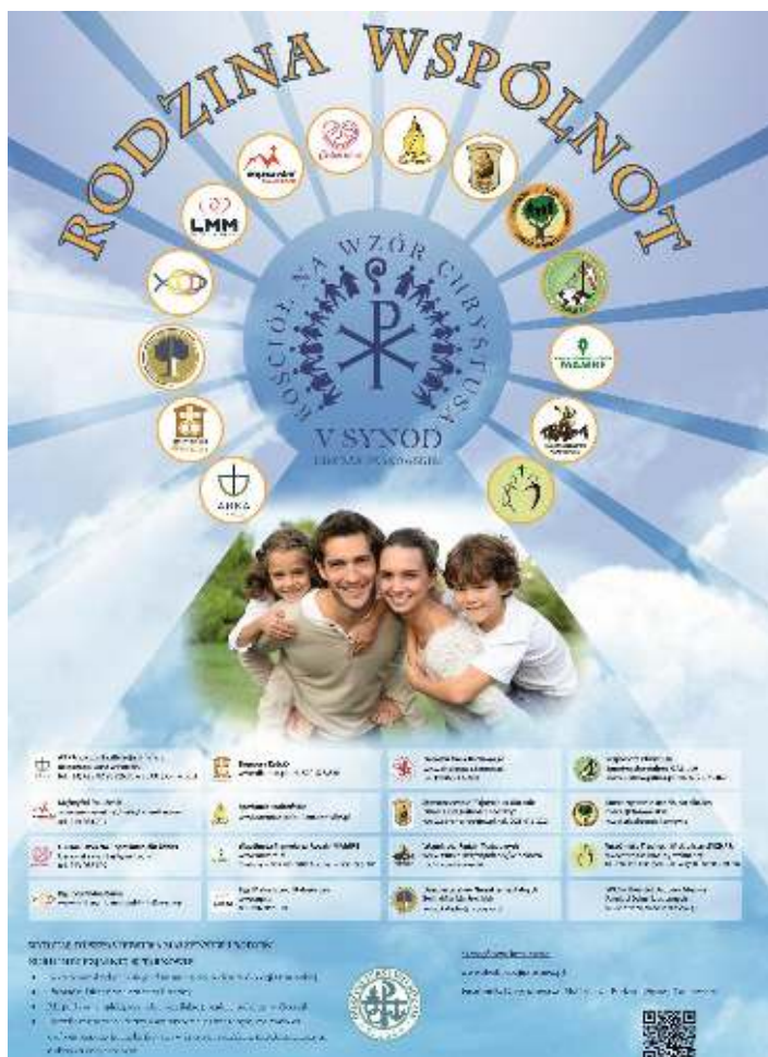
Rodzina wspólnot. Grafika synodalna promująca ideę „Rodziny wspólnot” w pierwszym roku Synodu poświęconym rodzinie.

Spotkania Komisji Synodalnych: Regulamin V SDT zobowiązuje do posiedzeń co 2 miesiące