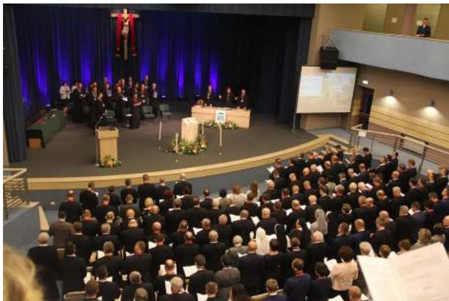
II Sesja Plenarna V SDT